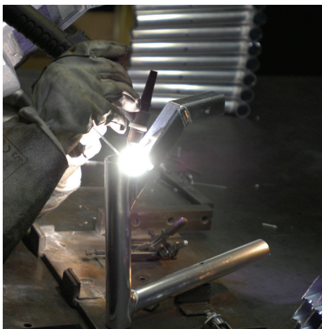
De Focus TIG 200 AC/DC PFC last in alle materialen, waaronder aluminium

De Focus TIG 200 AC/DC HP is uitgerust met PFC (Power Factor Correction), een elektronisch circuit