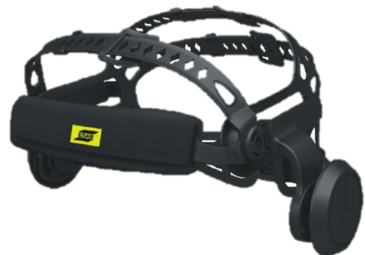
Halo™ comfort 5-punts hoofdband (vooraanzicht)