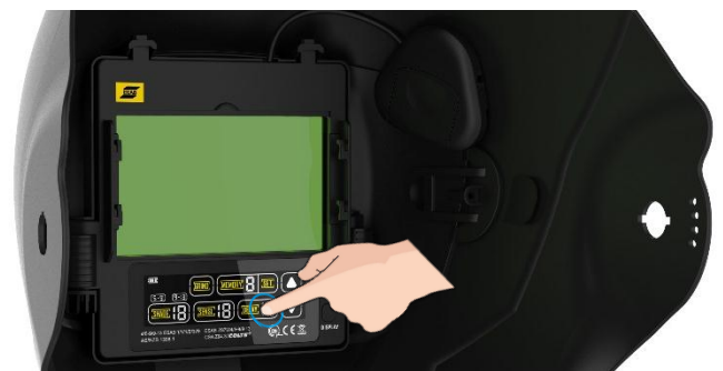
Hoge optische klasse ADF met kleuren Touch screen interface