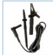
Meetsnoer + krokodillenklem