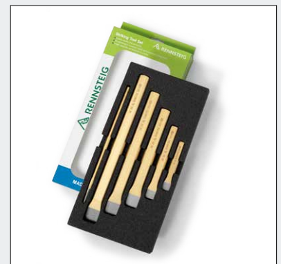
Praktische Schaumstoffeinlage sorgt für Ordnung am Arbeitsplatz

Quality under the surface: full body hardened Tempered safety striking head