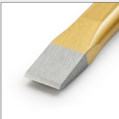
Hochwertige Werkzeuge - Poliertes Arbeitsende, geschliffene Schneide

Industrial quality tools Polished blade, ground edge