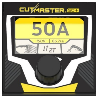
Eenvoudig en intuïtief TFT LCD-scherm