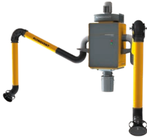
WallPro Double met rechtstreeks gemonteerde afzuigarmen (DM).