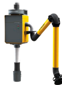
Optie: Uitbreidingsset stofbak

*Vraag uw verkoopvertegenwoordiger naar de volledige lijst met configuraties.