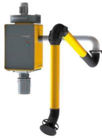
WallPro Single met externe gemonteerde afzuigarm (EM).