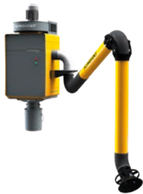
WallPro Single met rechtstreeks gemonteerde afzuigarm (DM).