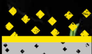
VERWISSELBAAR VOORFILTER EN P3 HOOFDFILTER

De digitaal geregelde luchtstroom is middels een keuzeknop aan te passen, waardoor de luchtstroom tussen 170 tot 220 Ltr/Min door het verwisselbare P3 filter heen kan stromen. De PAPR geeft een hoorbaar signaal als het P3 filter moet worden vervangen. Een oplaadbare lithium-ionbatterij met hoge capaciteit voorziet het stille (70 db) ventilatorsysteem tussen het opladen van maximaal acht uur stroom.